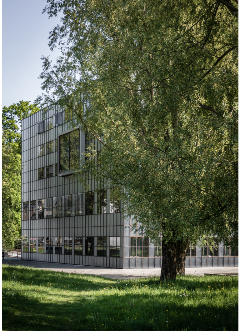
Neubau Armeeausbildungszentrum Luzern, 1995 – 1999 Bundesamt für Bauten und Logistik 1. Preis, offener Wettbewerb