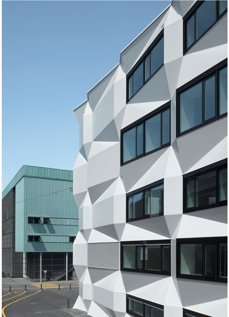
Universität Luzern und Pädagogische Hochschule Luzern Luzern, 2006 – 2011 Kanton & Stadt Luzern 1. Preis, offener Wettbewerb