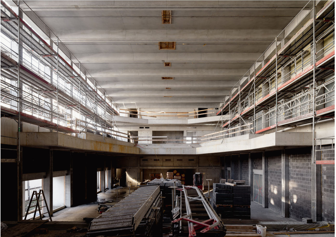
KIFF 2.0 Aarau, 2019 – Kiff – Kultur in der Futterfabrik 1. Preis, selektiver Wettbewerb