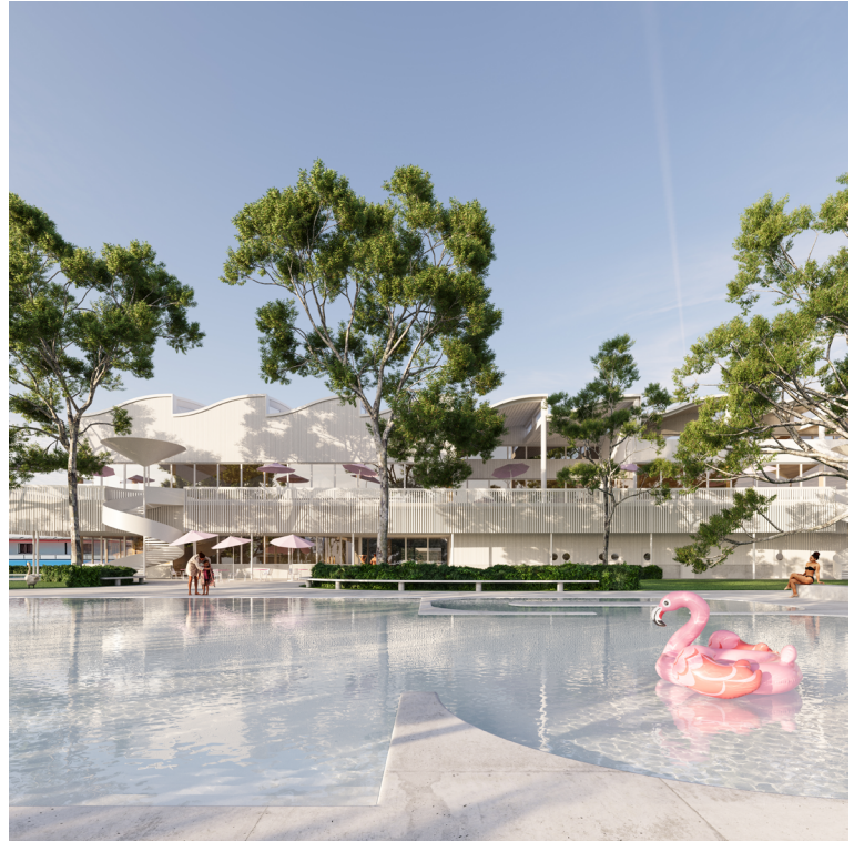
Schwimmbad Lido Rapperswil-Jona, 2024 Stadt Rapperswil-Jona Projektwettbewerb, selektiv