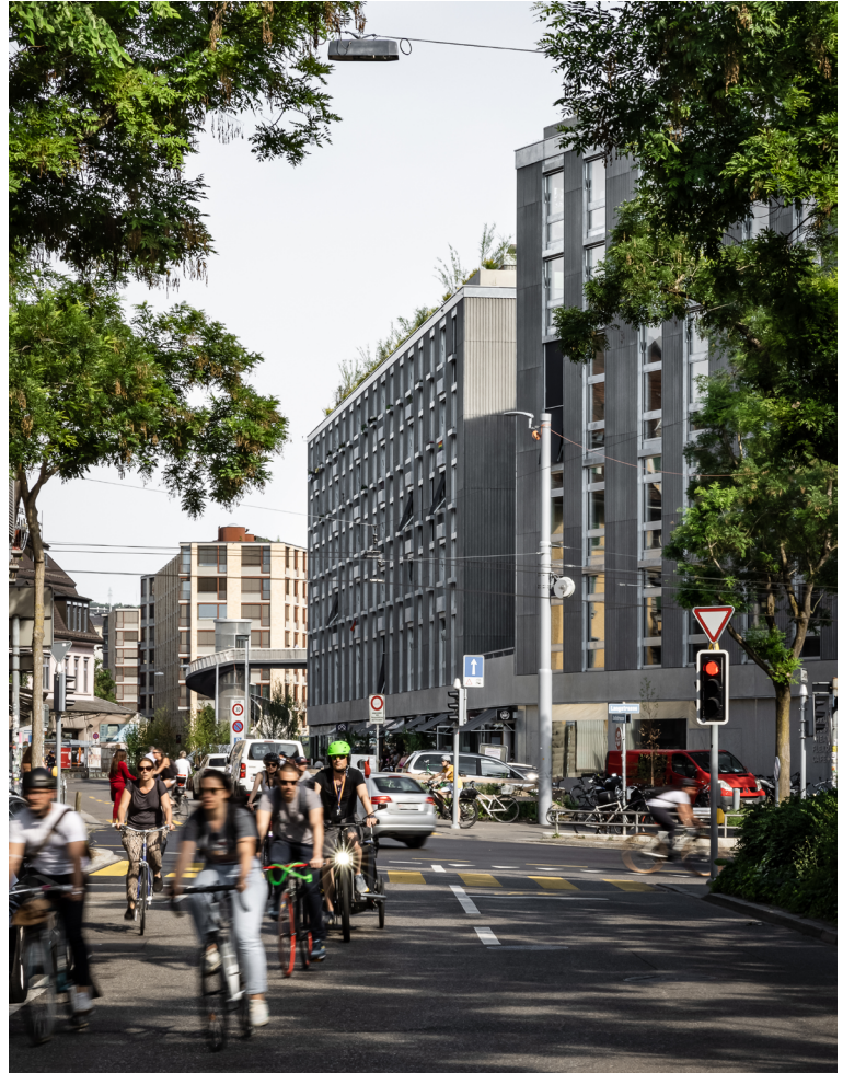
Wohn- und Gewerbeüberbauung Zollhaus Zürich, 2014 – 2021 Genossenschaft Kalkbreite 1. Preis, offener Wettbewerb