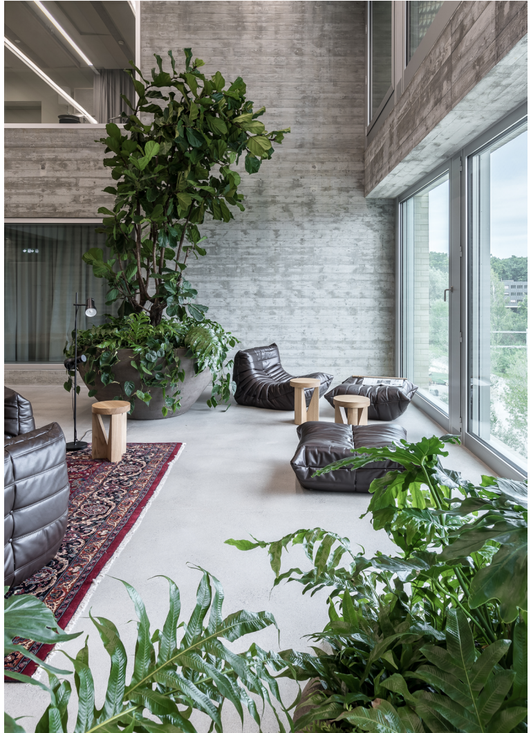
Neubau Hochschule Luzern - Musik Luzern, 2013 – 2020 Luzerner Pensionskasse ARGE mit Büro Konstrukt, Luzern 1. Preis, selektiver Wettbewerb