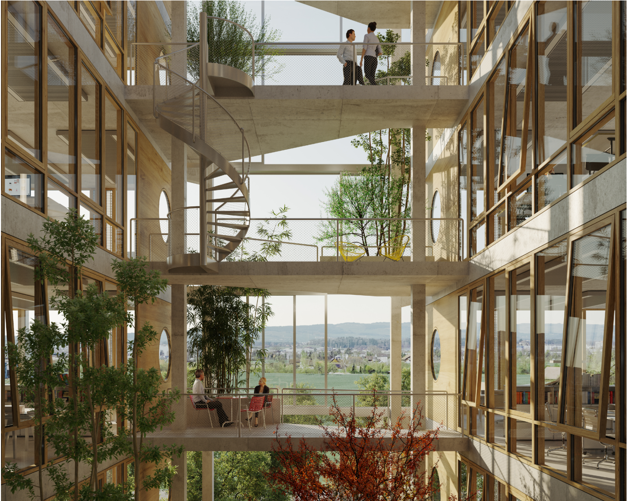
Unterfeld Süd Baufelder 3 und 4, Baar, 2021 – Implenia 1. Preis, selektiver Wettbewerb