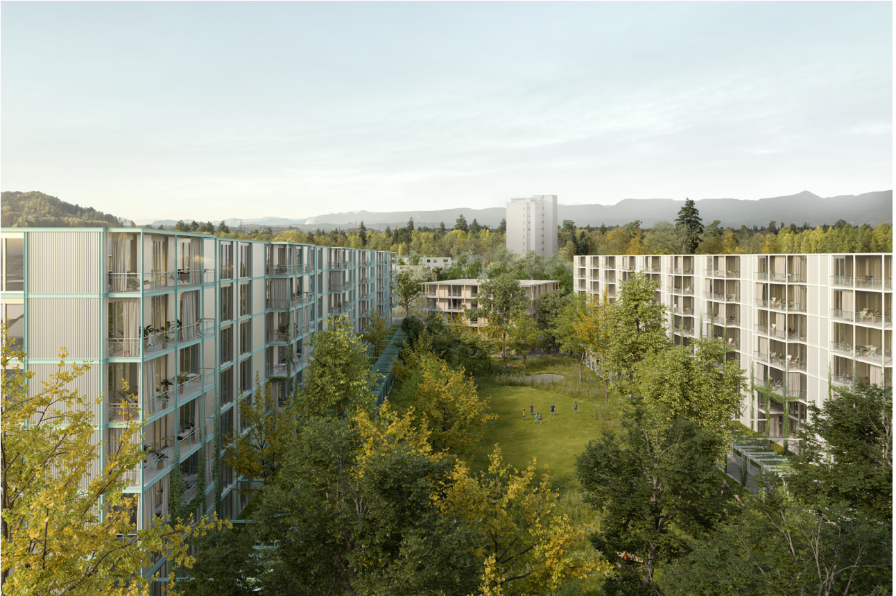
Artoz-Areal Lenzburg, 2024 Lentia Liegenschaften Projektwettbewerb, selektiv