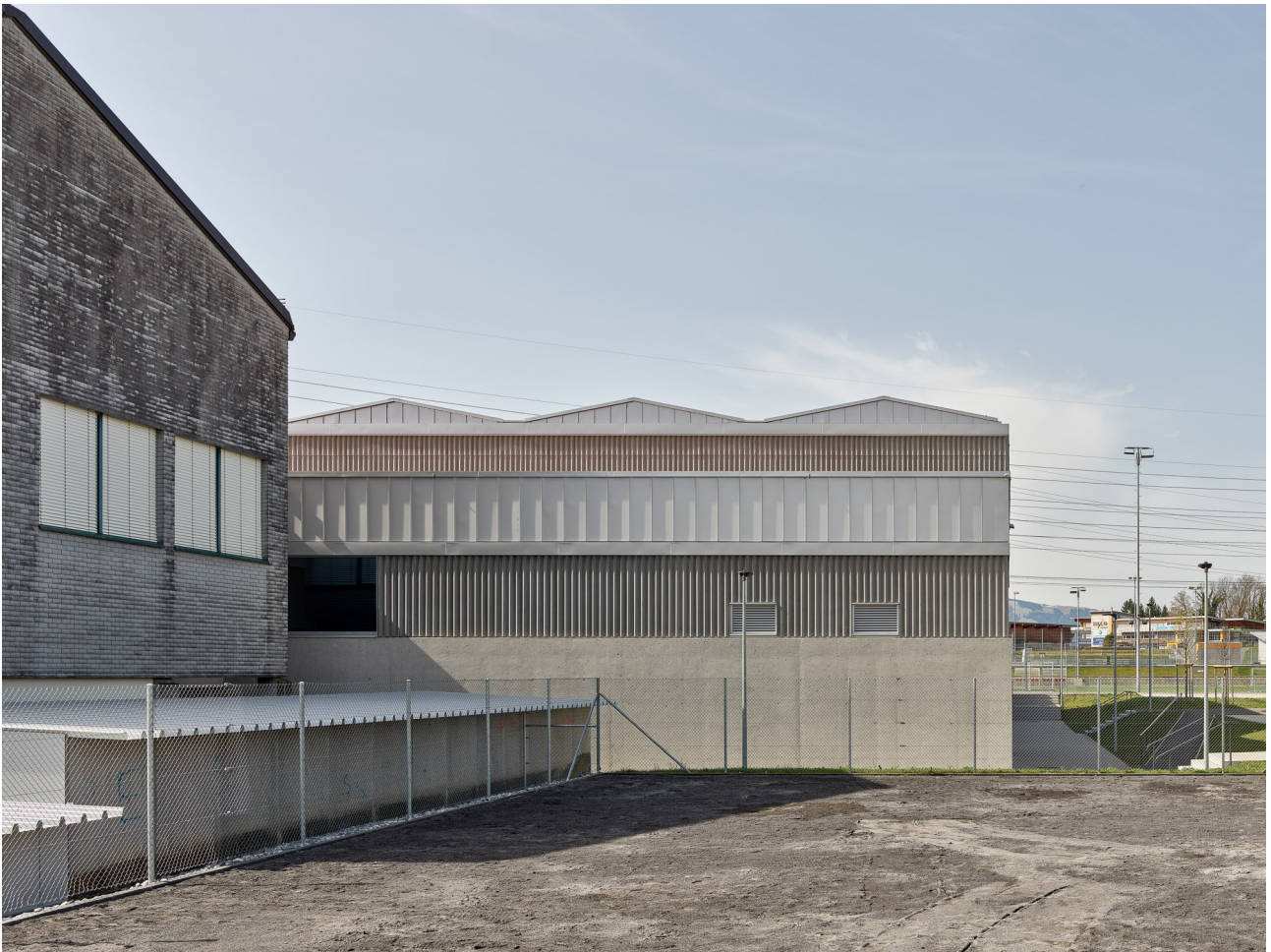
Sporthalle und Sportanlagen Eschenbach, 2016 – 2021 Gemeinde Eschenbach 1. Preis, selektiver Wettbewerb