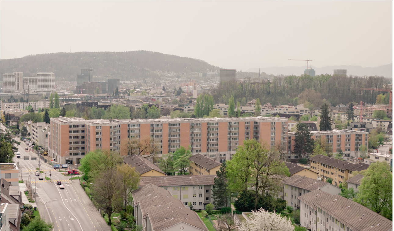
Siedlung Birchstrasse Zürich, 2017 – Baugenossenschaft Linth-Escher 1. Preis, eingeladener Wettbewerb