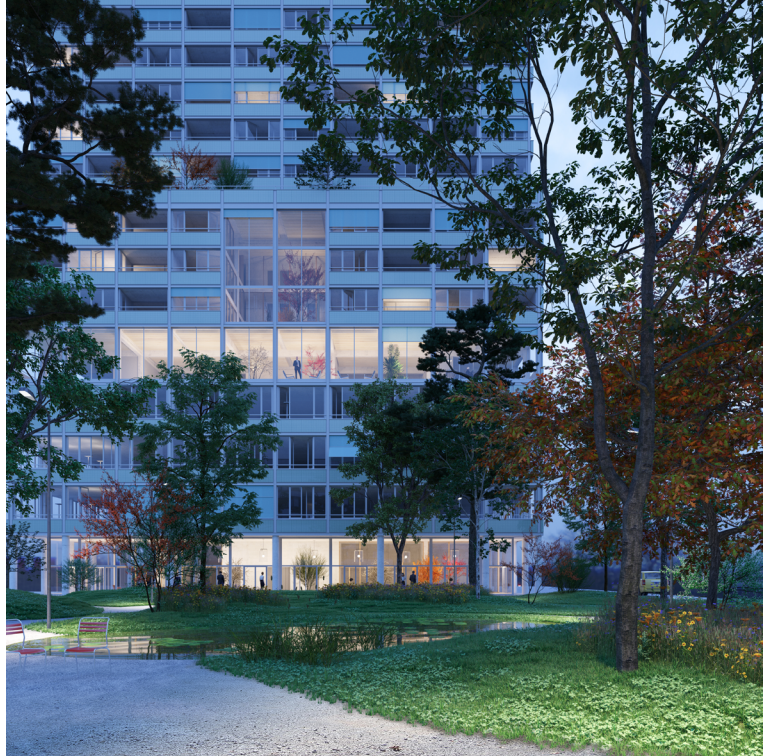
Hochhaus Sulzeralle Winterthur, 2022 Oase Service Projektwettbewerb, selektiv