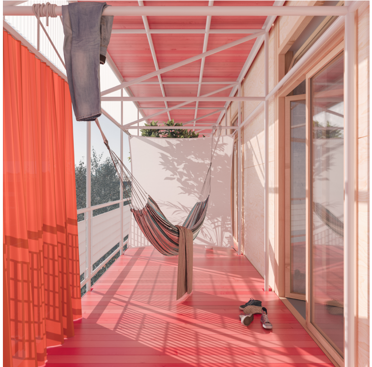
Umnutzung Büro zu Wohnen Schaerenmoosstrasse Zürich-Opfikon, 2022 Stiftung PWG Projektwettbewerb, selektiv, 4. Preis