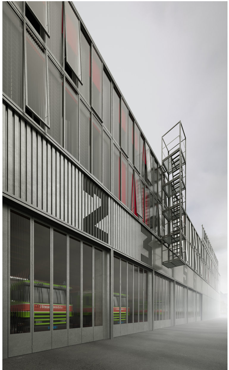
Wache Nord Zürich, 2017 – Immobilien Stadt Zürich 1. Preis, selektiver Wettbewerb